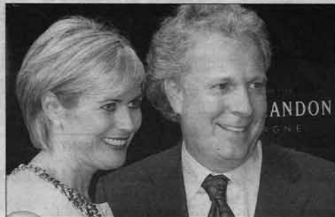
Le premier ministre du Québec Jean Charest et son épouse étaient de la partie.