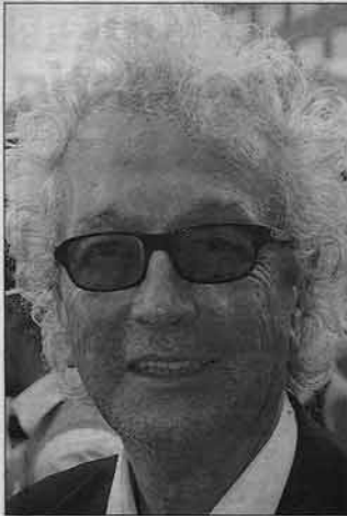
Luc Plamondon, qui s'y connaît dans le domaine des comédies musicales, avait bien hâte de voir une nouvelle mise en scène pour ce grand classique.