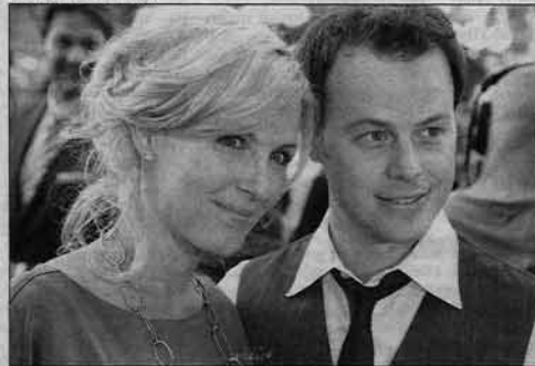
Véronique Cloutier et Louis Morissette, un couple toujours très remarqué sur les tapis rouges.